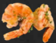
226. Ebi Yaki, Garnele B