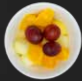
124. Früchte der Saison G