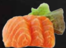
250. Sake Sashimi, Lachs D