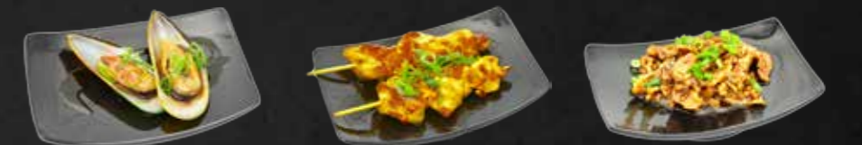
106. Mussels Yaki, Grünschalmuscheln N 107. Yaki Tori Hühnerspieße mit Yakitorisöbe A,F 108. Tonkatsu, Gebratenes Schweinefleisch A,3