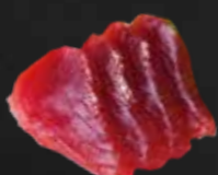
251. Maguro Sashimi, Thunfisch D