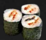
206. Unagi Maki, Aal D