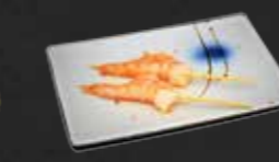
227. Ebi Kushi, Gegrillte Garnelenspieße B