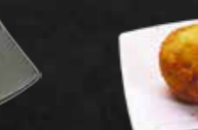
126. Frittierte Eiscreme, 1 Kugel A,G,7