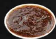
180. Schwarze Pfeffersoße A,3