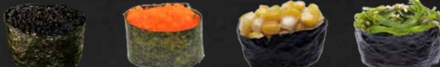
56. Black-Massago-Gunkan, Fischrogen 1 St. D 57. Orange-Massago-Gunkan, Fischrogen 1 St. D 58. Toumorokoshi Gunkan, Mais 1 St. 59. Wakame Gunkan, Algensalat 1 St. 2,K