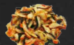
220. Chukka Ika Sansai, Oktopussalat N