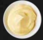
185. Mayonnaise G