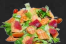
221. Sashimi Salad, Lachs & Thunfisch D