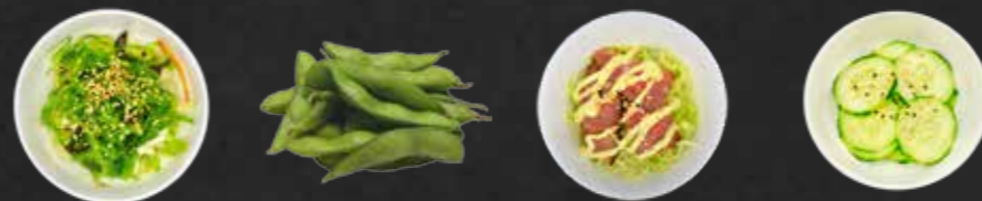
70. Goma Wakame, Grüner Algensalat 2,K 71. Edamame, Junge Sojabohnen F 72. Beef Salad, Rindfleisch G 73. Kyuri Tsukemono, Eingelegter Gurkensalat K