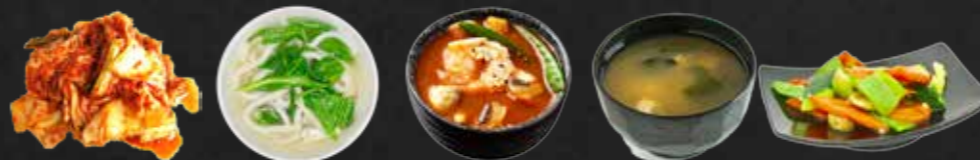
74. Kimchi, Scharfer eingelegter Chinakohl 75. Udon noodlesoup, Nudelsuppe A 76. Dong Yong Soup, Thailändische Suppe B,F 77. Miso Suppe nach japansicher Art F 78. Yasaitame, Gebrilltes Gemüse