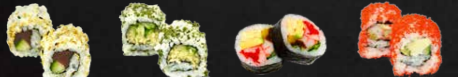
34. Tuna Avocado Insideout 2 St. D,K 35. Vegito Maki vegetarisch 2 St. 36. Futo Maki, Surimi, Avocado, Gurken, Eier, Kürbis, Wakame 2 St. C,B 37. Red-California Maki, Surimi, Gurken, Fischrogen 2 St. B,D