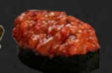
60. Spicy Sake Gunkan, D,F Pikanter Lachs 1 St.