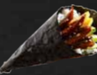
209. Unagi Temaki, Aal F