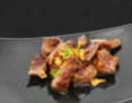
222. Gyu Hireniku, Rindfleisch A,3