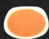
183. Erdnusssoße E,A,3