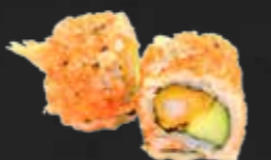
208. Ebi Tempura Roll Garnelen & Gurke A,B,K