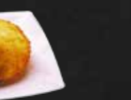
127. Schwarze Sesameis G,7