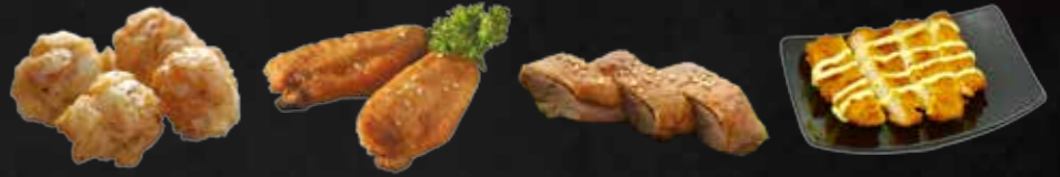
95. Tori Karaage, Frittierte Hühnerfleischbällchen, 4 St. A 96. Teba Furai, Chicken Wings, 2 St. A,K 97. Ahiru No Karaage, Knusprige Ente gebacken A,K 98. Crispy Fish, Frittiertes Pangasiusfilet D,G