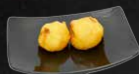
120. Gebackene Banane A