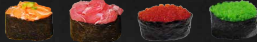
52. Sake Gunkan, Lachs 1 St. D 53. Maguro Gunkan, Thunfisch 1 St. D 54. Red-Massago-Gunkan, Fischrogen 1 St. D 55. Green-Massago-Gunkan, Fischrogen 1 St. D