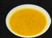
184. Currysoße 3,A