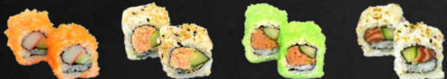
30. California Maki 2 St. B,D 31. Sake Avocado D,K Maki, Gekochter Lachs, Avocado, Sesam 2 St. 32. Spicy Tuna Maki, Pikanter Thunfisch 2 St. B,D 33. Sake Avocado Insideout 2 St. D,K