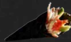
49. Kani Temaki, Surimi 1 St. B