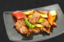
109. Hak Chiu Beef, Rindfleisch mit schwarzem Pfeffer 3