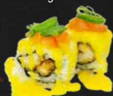
205. Tori Roll, Hühnerfleisch & Mangosöbe A