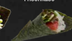
46. Maguro Temaki, Thunfisch 1 St. F