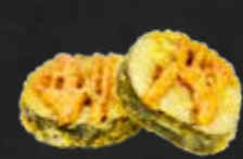
91. Tempura Roll, Frittierte Sushirolle, 2 St. A,B,F