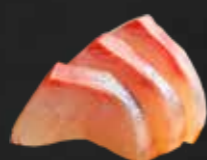
252. Suzuki Sashimi, Wolfsbarsch D