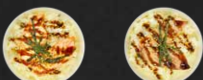
65. Sake Don, Lachs auf Reis 1 St. D,F 66. Maguro Don, Thunfisch auf Reis 1 St. D,F