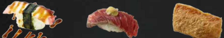
5. Tako Nigiri, Oktopus 1 St. N 6. Gyu Tataki Nigiri, Rindfleisch 1 St. 7. Inari, Süßliche Toufutasche mit Reisfüllung 1 St. F