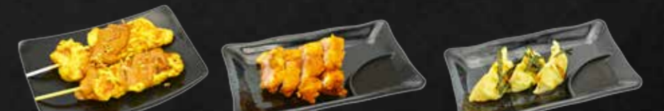
113. Yaki Tori Hüherspieße mit Erdnusssoße E,F,3 114. Tonkatsu Paniertes Schweinefleisch A,3 115. Gyoza Frittierte Teigtaschen mit Hühnerfleischfüllung A