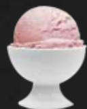
123. Erdbeereis G,7