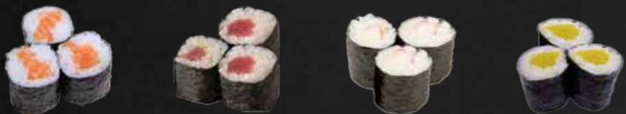
20. Sake Maki, Lachs 3 St. D 21. Tekka Maki, Thunfisch 3 St. D 22. Kani Maki, Surimi 3 St. B 23. Oshinko Maki, Eingelegter Rettich 3 St.