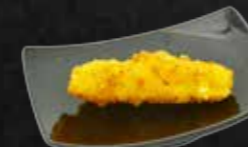
231. Cheese Sticks, Frittierte Käsestange G,A