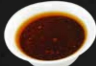
181. Teriyaki-Soße F,A,3