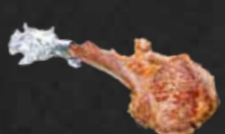
225. Kohitsuji, Lammkotelett