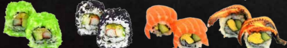
38. Green-California Maki, Surimi, Gurken, Fischrogen 2 St. B,D 39. Black California Maki - Surimi, Gurken, Fischrogen 2 St. B,D 40. Chiizu Sake Omelette, Gurke, Frischkäse 2 St. D,G 41. Chiizu Unagi Omelette, Gurke, Frischkäse 2 St. C,D,G