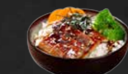
211. Unagi Don, Aal auf Reis A,F,K