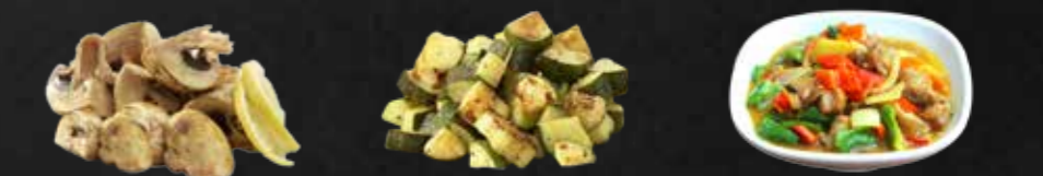
110. Yaki Mushrooms, Gegrillte Champignons 111. Yaki Zucchini, gegrillt 112. Curry Tori, Hühnerfleisch in Currysoße A,3