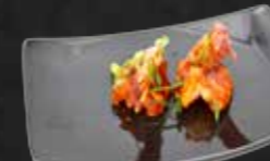
228. Yukisaki Ebi Garnelen mit süß-sauer-scharfer Soße B