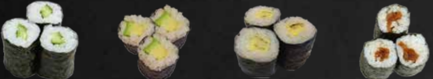
24. Kappa Maki, Gurke 3 St. 25. Avocado Maki 3 St. 26. Tamago Maki, Omelette 3 St. C 27. Kanpyo Maki, Eingelegter Kürbis 3 St.