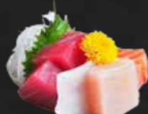
253. Sashimi Mix D