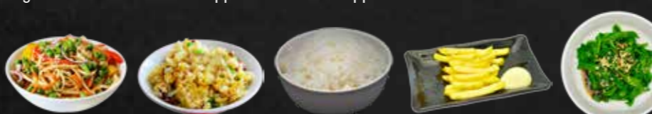
79. Yaki Soba, Gebratene Nudeln A,F,3 80. Yaki Meshi, Gebratener Reis F,3 81. Gohan, Gekochter Reis 82. Pommes frites 83. Horenso Spinat K