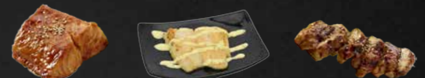
103. Sake Yaki, Lachs gegrillt D,F,K 104. Pangasius Yaki, gegrillt D,G 105. Tori Teriyaki, Hühnerfleisch F,K,3