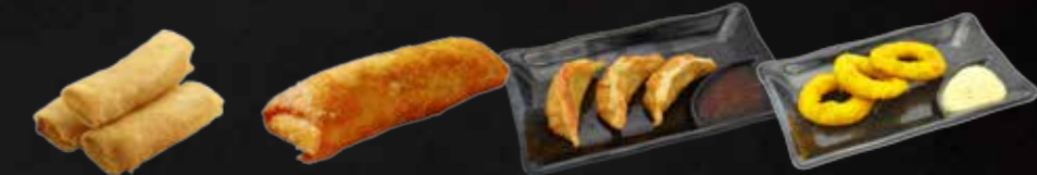
90. Mini-Springroll, gefüllt mit versch. Gemüse, 3 St. A 92. Harumaki, Fleisch- und Gemüsefüllung, 1 St. A 93. Gyoza, Geb. Teigtaschen mit Hühnerfleischfüllung, 3 St. A 94. Ika Tempura, Frittierte Tintenfischringe, 3 St. A