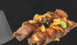
224. Usu Yaki, Rindfleischrollen A,3