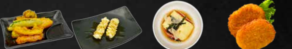
99. Yasai Tempura, Frittiertes Gemüse A 100. Ika Yaki, Gegrillter Tintenfisch N 101. Agedashi Tofu, Frittierte Tofu, 2 St. F 102. Yaki Korokke, Japanische Gemüsekorokette, 2 St.