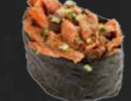
61. Spicy Maguro Gunkan, Pikanter Thunfisch 1 St. D,F